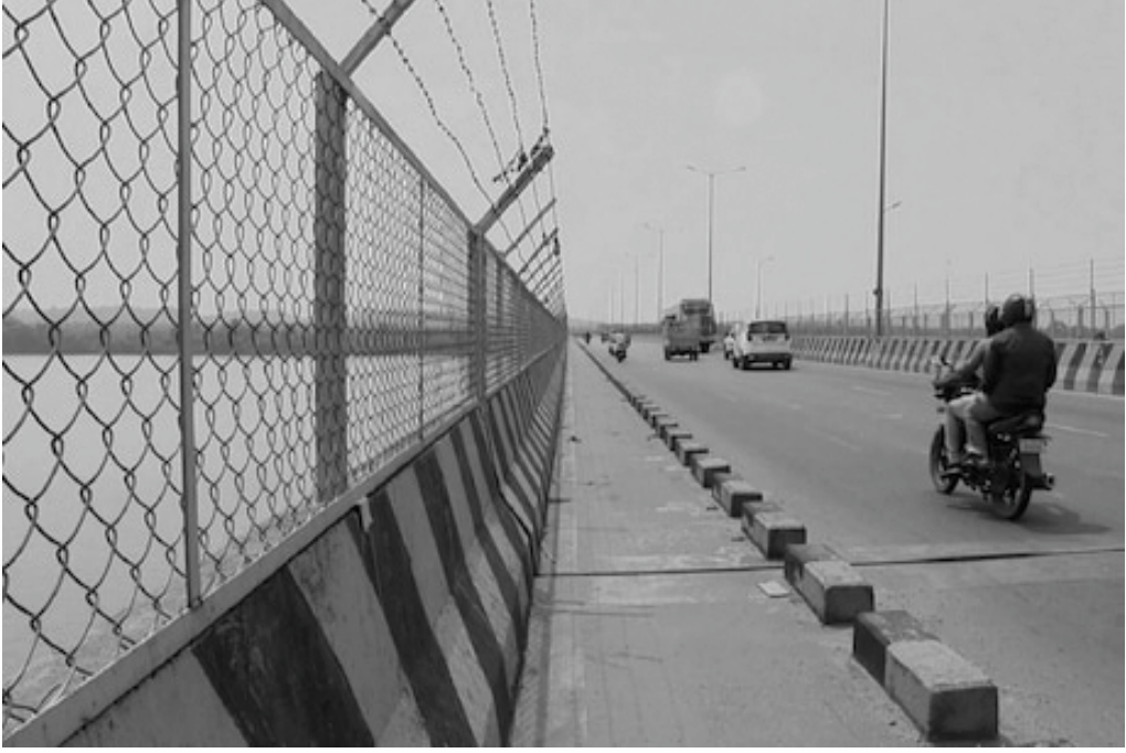
ನೀಡಬೇಕಿತ್ತು. ನಿರ್ಮಾಣ ಮಾಡುವ ಇಂಜಿನಿಯರ್‌ಗಳು ಸೇರಿ ಕಳಪೆ ಗುಣಮಟ್ಟದ ವಸ್ತುಗಳನ್ನು ಹಾಕಿದ್ದಾರೆ ಎಂದು ಸಾರ್ವಜನಿಕರು ಅಭಿಪ್ರಾಯಪಟ್ಟಿದ್ದಾರೆ.

ನೇತ್ರಾವತಿ ಸೇತುವೆಗೆ ತಡೆ ಬೇಲಿ ಹಾಕಿದ ಬಳಿಕ ಇಲ್ಲಿ ನದಿಗೆ ಹಾರಿ ಆತ್ಮಹತ್ಯೆ ಮಾಡಿಕೊಳ್ಳುವವರ ಸಂಖ್ಯೆ ಬಹಳಷ್ಟು ಕಡಿಮೆಯಾಗಿದೆ. ಜತೆಗೆ ಗುಣಮಟ್ಟದ ಸಿಸಿ ಕ್ಯಾಮರಾ ಕೂಡ ಅಳವಡಿಸಿ ಮಂಗಳೂರು ನಗರ ಪೊಲೀಸ್ ಠಾಣೆಗೆ ಸಂಪರ್ಕ ಕಲ್ಪಿಸಲಾಗಿದೆ. ಇದರಿಂದ ಸೇತುವೆ ಮೇಲೆ ನಡೆಯುವ ಚಟುವಟಿಕೆಗಳ ಮೇಲೆ ಪೊಲೀಸರು ನಿಗಾ ಇಟ್ಟಿದ್ದಾರೆ. ವಾಹನಗಳಲ್ಲಿ ಬಂದು ಸೇತುವೆ ಮೇಲಿನಿಂದ ನದಿಗೆ ಕಸ ಬಿಸಾಡುವವರ ಸಂಖ್ಯೆಯೂ ಕಡಿಮೆಯಾಗಿದೆ. ತಡೆ ಬೇಲಿ ಎತ್ತರ ಇರುವ ಕಾರಣ ಕಸ ಬೇಲಿಯಲ್ಲೇ ಸಿಕ್ಕಿ ಹಾಕಿಕೊಳ್ಳುತ್ತದೆ.